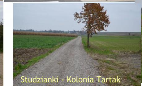
Studzianki - Kolonia Tartak