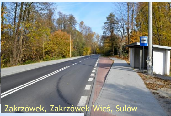
Zakrzówek, Zakrzówek-Wieś, Sulów