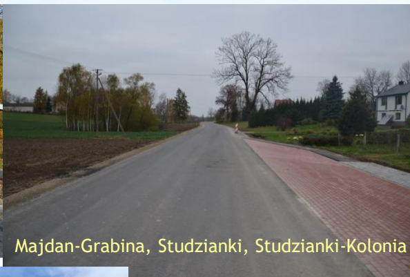
Majdan-Grabina, Studzianki, Studzianki-Kolonia