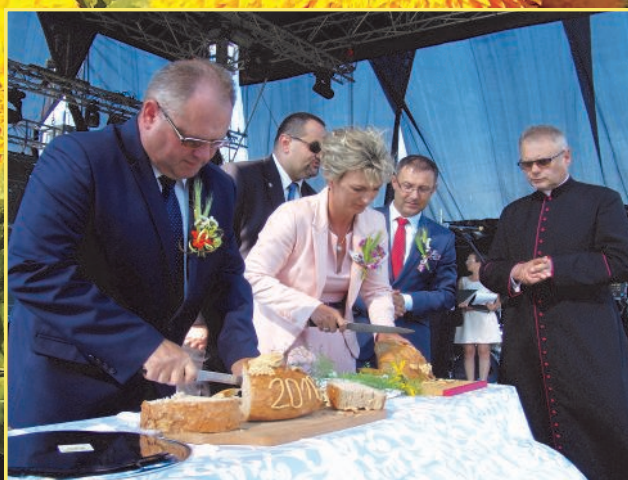
Dożynki Powiatowe w Zakrzówku

Biuletyn informacyjny wydawany przez Gminny Dom Kultury w Zakrzówku