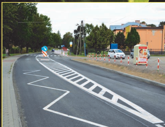
Przebudowa drogi powiatowej w Sulowie