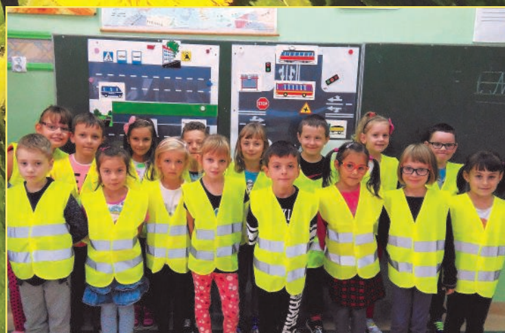
Akcja „Bezpieczna droga do szkoły”