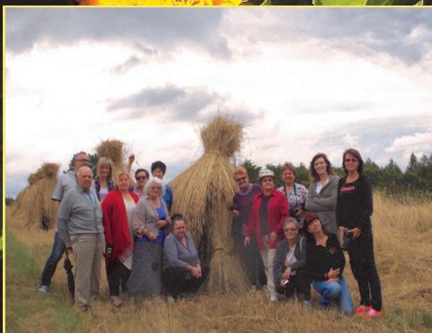
Ogólnopolski Plener Malarski